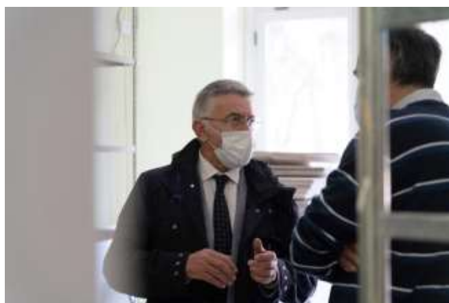
foto 3 Direttore Generale - potenziamento Malattie Infettive