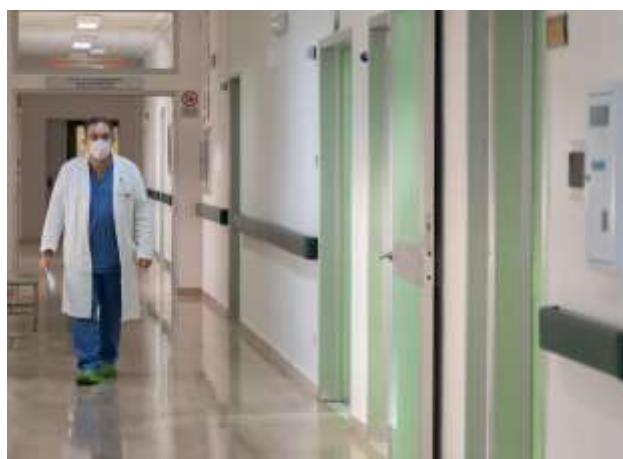
Foto 4 potenziamento Malattie Infettive