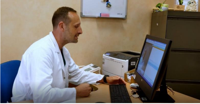
televisita - Ambulatorio MICI - Casa Sollievo