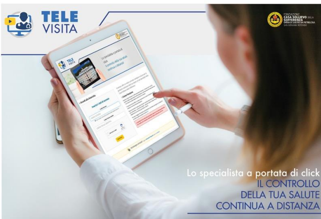
Televisita - IRCCS Casa Sollievo della Sofferenza