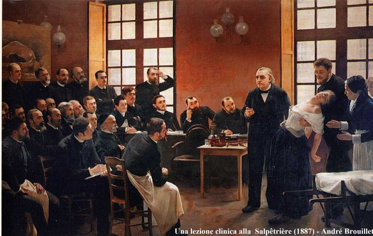
Una lezione clinica alla Salpêtrière (1887) - André Brouillet