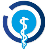
OMCeO ORDINE PROVINCIALE DI CHIETI DEI MEDICI CHIRURGI E DEGLI ODONTOIATRI