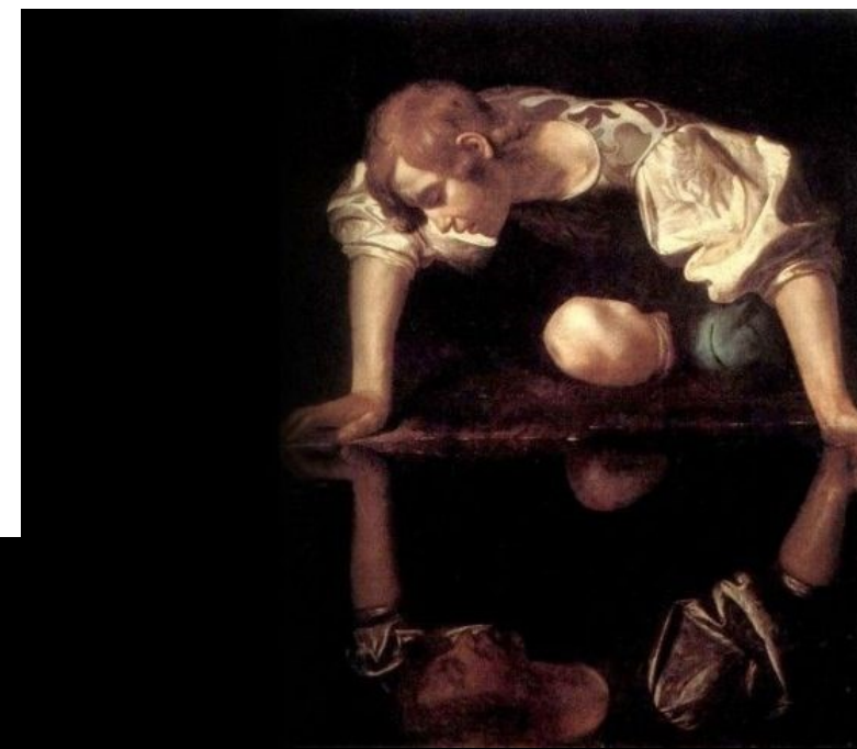
Olio su tela: Narciso allo specchio (1597-1599) Michelangelo Merisi da Caravaggio Galleria Nazionale d'Arte Antica Palazzo Barberini, Roma